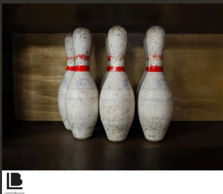
צילום: לטיסיה בולו <<